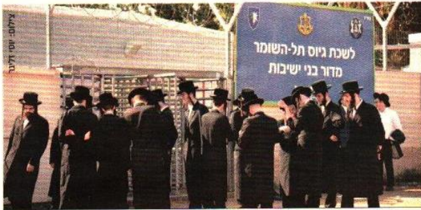
עמדה ביעדי הגיוס של חרדים לצה"ל

החרדים שמשרתים במסלול שח"ד מקבלים הכשרות מקצועיות של נהגים, מלגנים, ולבנים וכו', וברמה הגבוהה יותר הכשרות בתחומי המחשוב והתכנות. מלחי מהיר כי החרדים לא מגיילים את השוויון בנסל בין אוכלוסיית החרדים לבין המגזרים בצה"ל שאינם חרדים. "הגיוס החרדי של החרדים לצבא הוא פריק נוסף בהפיכתו של צה"ל למצב האחרים, לצבא מקצועי למחצה, שמגייס בעודת כוחות השוק את הכשרות החלטות מקרב אוכלוסיית הפריפריה שעדי כה לא גויסו לשירותיו ממעמקי רותים, מיליונים, אומנים וחברתיים, ונראה שאנחנו נמצאים במצב ביניים שבו הצבא מגיש את רובו כן מודל גיוס החרדי למחל. צבא מקצועי, "מכיר מלחי. "ניתן להניח כי תהליכים אלה ישיעו בעתיד גם על ציפיותיהן ותביעותיהן של קבוצות פריפריה נוספות מהצבא, שיתייחסו לצה"ל כאל מסלול תעסוקתי ופחות כאל "שירות אומנים". "הרעיון כזה, שבו הגיוס לצה"ל יתנהל על בסיס היצע וכיכוש למקצועות צבאיים, יאלץ את הצבא ואת התכונה הישראלית לבחון מחדש את מודל השירות הנוכחי בצה"ל וזאת תוך ציפייה הולכת וגדלה להפחתת את עלויות השירות תחת פיקטורות ונורמות מבוססות שוק".