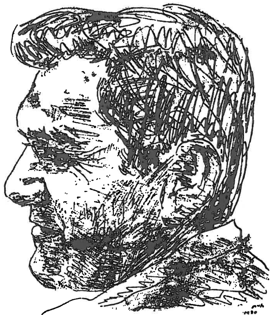
רישום מאת חיים טרפול