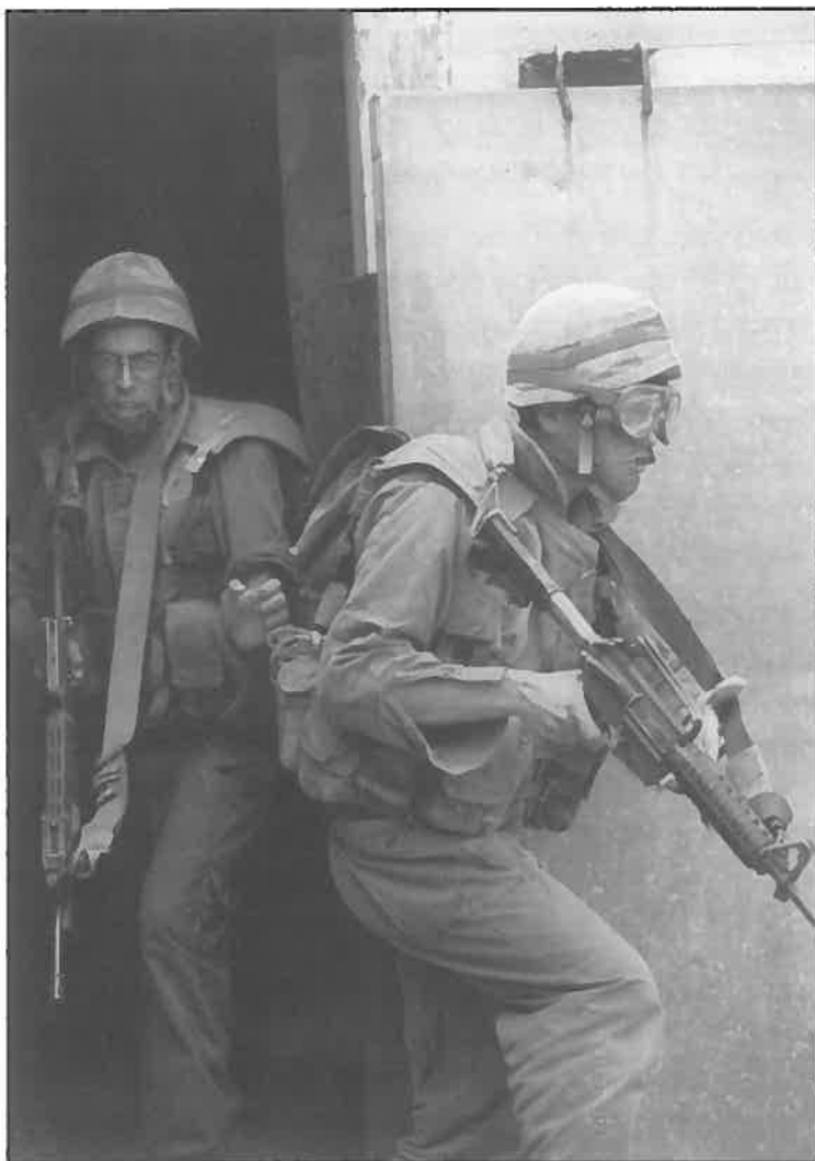
חיילי חטיבת "גולני" באימון לחימה בשטח בנוי.

מתגדלים כלל לצה"ל (אילו השירות היה התנדבותי) מגיע בשנים מסוימות לאזור ה-5% ולפעמים הוא בסביבות ה-10%-12%. אבל השינויים האלה הם בבחינת תגודות שמתחלפות, ואולי גם לא במקרה. אם יש, למשל, רמיון בין נתונים מסוימים ב-1984 למה שאנחנו רואים היום, אין זה מפליא שכן ב-1984, שנה וחצי או שנתיים לאחר מלחמת לבנון, כמו גם בסקר האחרון שנערך בשלהי האינתיפאדה, מתגלה בסקרים ירידה מסוימת בנכונות לשרת, יתכן שכאז כן עתה הרבר נובע מאיזשהן הסתייגויות פוליטיות או מוסריות שחש חלק מהנוער כלפי השרות הצבאי. אבל כאשר בוחנים את התגודות האלה לאורך זמן הן עלולות ויורדות חליפות, והתופעה החשובה היא דווקא התמונה הרב-השנתית, לאורך זמן. ואם נמתח קו לאורך השנים הללו, נגלה קו יציב למדי ואפשר שניתן לצפות לקו רומה גם בשנים הבאות.