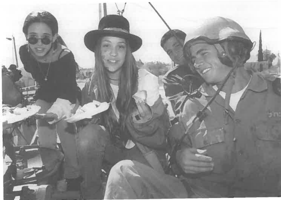
ילדי קיבוץ רמת רחל מחלקים משלוח מנות לחיילי עוצבת שריון, פורים תשנ"ה.

בדרכים שונות לפי אותה ההלכה. אבל, האנשים האלה אינם מייצגים עמדה רשמית ומפורשת, אלא את הרצון שהרעה שלהם תהיה הדעה המונופוליסטית.