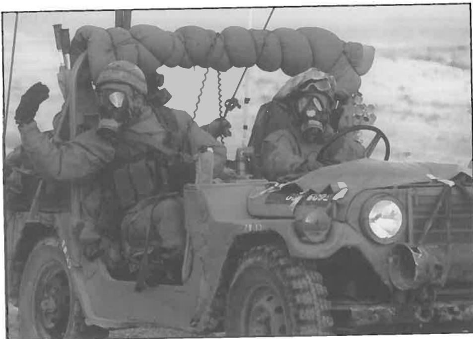
חיילי חטיבת "גבעתי" בתרגיל תנועה ולחימה בשטח נגוע בחומר לחימה כימי.