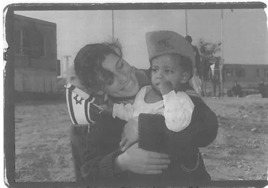
חיילות נח"ל מסייעות בקליטת עולים מאתיופיה באתר הקרוונים מבועים בדרום הארץ.

אולם הסימן הבולט ביותר לשינוי התפיסתי הוא במרכיב כוח האדם – התזווה מתפיסה של "צבא העם" לצבא יותר מקצועי. העיקרון של "צבא העם" מבוסס על ראיית השירות הצבאי, לפחות להלכה, כשירות שיווינוני – שירות חובה לכל האזרחים. לעומת זאת, צבא מקצועי, שיש לו רפואי התנהגות וקרטיריונים אחרים, יכול להיות בררני הרבה יותר. דומה שצה"ל אכן הופך להיות בררני יותר בכל אחד ממפלסיו – בסדיר, במילואים ובקבע. בעקבות זאת יש מי שמשרתים הרבה פחות מבעבר ולעומת זאת, יש מי שמשרתים הרבה יותר. כך בסדיר – במסגרת קד"צים; וכך במילואים,