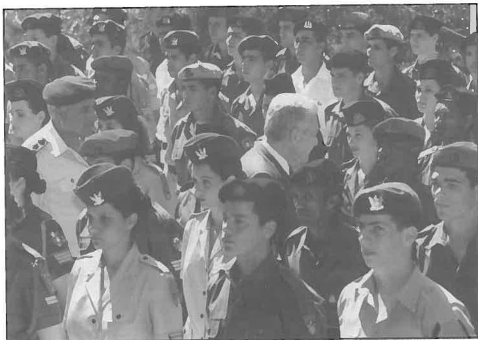
נשיא המדינה עזר וייצמן והרמטכ"ל רא"ל אמנון ליפקין-שחק בקבלת-פנים לחיילים מצטיינים, יום העצמאות תשנ"ה.

כי אי-אפשר להמשיך היום ב"סיפור הישן". וזה מה שעושים רוב החוקרים: מוסיפים לתאר את החברה הישראלית, את יחסי הצבא והחברה הישראלית, כפי שתיארו אותם במשך ארבעים שנה.